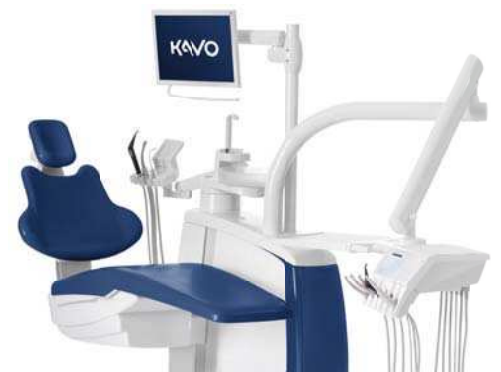
ESTETICA E80 Vision

Holen Sie sich Ihr Upgrade des Jahres – zum Beispiel eine KaVo ESTETICA™ E80 Vision zum Preis einer ESTETICA E70 Vision. Inklusive aller First-Class-Highlights wie der motorischen Horizontalverschiebung, der motorischen Sitzbankanhebung und vielem weiteren Zubehör.