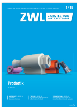
TK-Soft Produktfamilie mit TK-Soft mini, TK-Soft Ceram & TK-Soft (© Si-tec)

Bezugspreis: Einzelheft 5,- Euro ab Verlag zzgl. gesetzl. MwSt. Jahresabonnement im Inland 36,- Euro ab Verlag inkl. gesetzl. MwSt. und Versandkosten. Kündigung des Abonnements ist schriftlich 6 Wochen vor Ende des Bezugszeitraums möglich. Abonnementgelder werden jährlich im Voraus in Rechnung gestellt. Der Abonnent kann seine Abonnementbestellung innerhalb von 2 Wochen nach Absenden der Bestellung schriftlich bei der Abonnementverwaltung widerrufen. Zur Fristwahrung genügt die rechtzeitige Absendung des Widerrufs (Datum des Poststempels). Das Abonnement verlängert sich zu den jeweils gültigen Bestimmungen um ein Jahr, wenn es nicht 6 Wochen vor Jahresende gekündigt wurde.