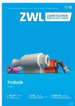
TK-Soft Produktfamilie mit TK-Soft mini, TK-Soft Ceram & TK-Soft

Bezugspreis: Einzelheft 5,- Euro ab Verlag zzgl. gesetzl. MwSt. Jahresabonnement im Inland 36,- Euro ab Verlag inkl. gesetzl. MwSt. und Versandkosten. Kündigung des Abonnements ist schriftlich 6 Wochen vor Ende des Bezugszeitraums möglich. Abonnementgelder werden jährlich im Voraus in Rechnung gestellt. Der Abonnent kann seine Abonnementbestellung innerhalb von 2 Wochen nach Absenden der Bestellung schriftlich bei der Abonnementverwaltung widerrufen. Zur Fristwahrung genügt die rechtzeitige Absendung des Widerrufs (Datum des Poststempels). Das Abonnement verlängert sich zu den jeweils gültigen Bestimmungen um ein Jahr, wenn es nicht 6 Wochen vor Jahresende gekündigt wurde.