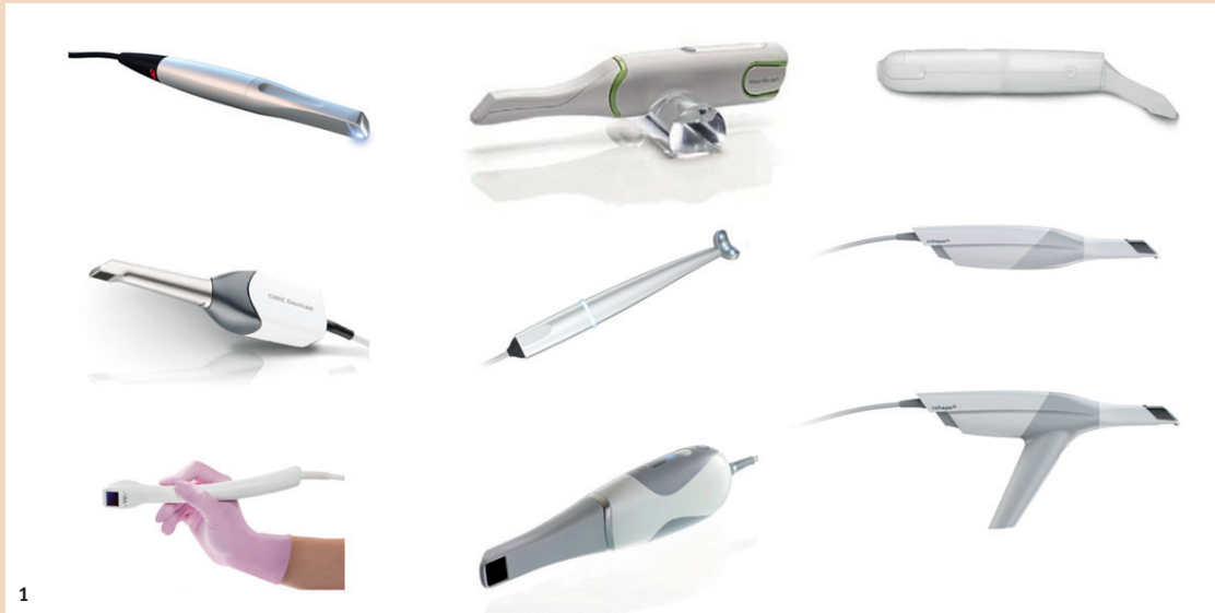
Abb. 1: Nicht nur Größe und Gewicht, auch die Form der Handstücke ist ein Entscheidungskriterium bei der Intraoralscanner-Wahl.