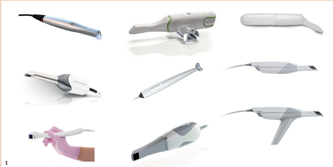
Abb. 1: Nicht nur Größe und Gewicht, auch die Form der Handstücke ist ein Entscheidungskriterium bei der Intraoralscanner-Wahl.