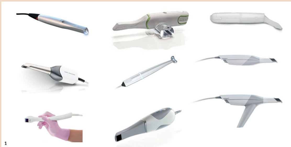
Abb. 1: Nicht nur Größe und Gewicht, auch die Form der Handstücke ist ein Entscheidungskriterium bei der Intraoralscanner-Wahl.