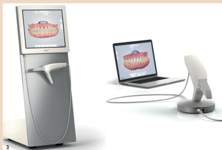
Abb. 3: Zwei Geräte-Varianten werden unterschieden: die Cart- (links) und die Laptop-Version (rechts). Im Bild: TRIOS® Intraoralscanner von 3Shape.

Einige Geräte bieten die Option an, die Präparationsgrenze direkt am Scanner festzulegen. Dies ist besonders dann hilfreich, wenn durch schwierige Verhältnisse eine klare Festlegung der Präparationsgrenze im Labor fraglich erscheint.