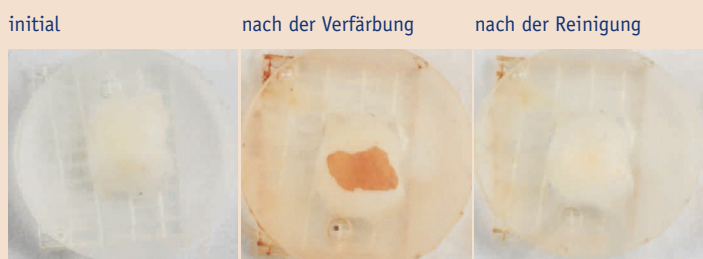
Fotografische Abbildung der Zahnschmelzproben im Ausgangszustand, nach Verfärbung und nach der Reinigung. Die Reinigung der Proben erfolgte mit einer cellulosehaltigen Zahnpasta.

Fraunhofer IMWS testet umweltfreundliche Mikroplastik-Alternativen.