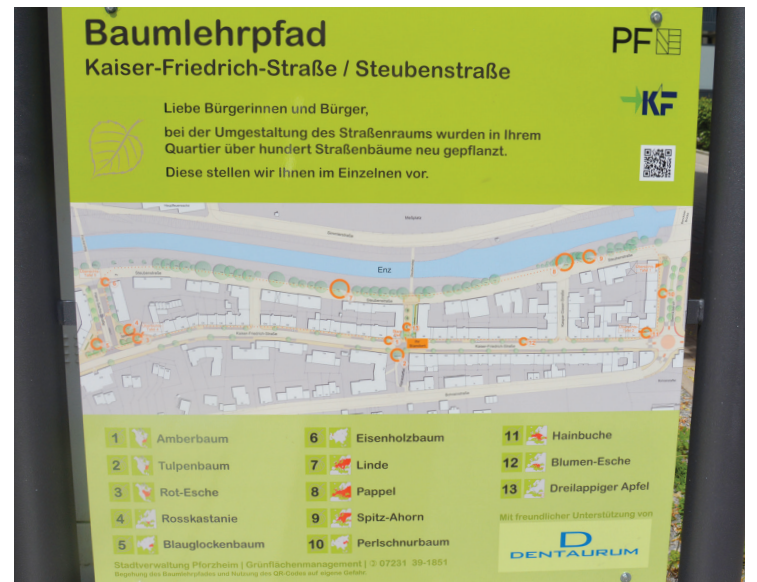
Ein Wegweiser zeigt Baumfreunden die verschiedenen Arten an.