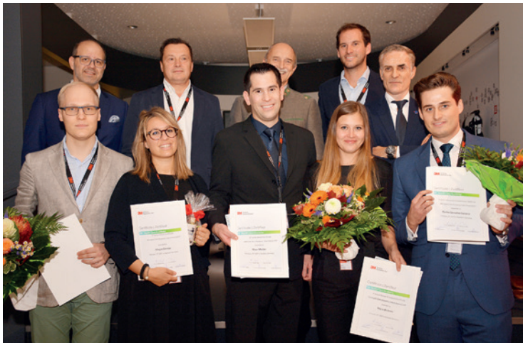
Award-Preisträger und Expertenjury des 14. Talent Award.

Der zahnmedizinische Nachwuchs stellt sich vor.