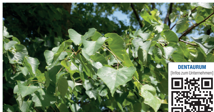
Nur einer der Bäume, die den Baumlehrpfad säumen: die Pappel.

Weitere Infos über das Umweltmanagement der Dentaurum-Gruppe erhalten Sie unter https://www.dentaurum.de/de/umwelt-18984.aspx in der aktuellen Umwelterklärung des Unternehmens oder unter angegebenem Kontakt.