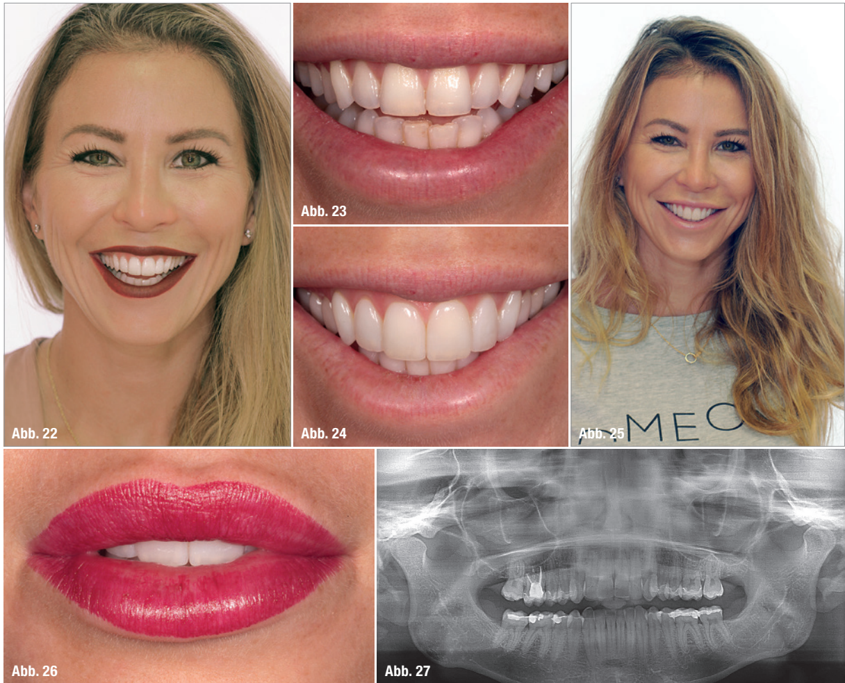
Abb. 22, 25 und 26: Die Patientin mit Ihrem Traum vom „Perfect Smile“. Abb. 23 und 24: Der Vergleich der Ausgangs- und Abschlussituation. Abb. 27: Das OPT-Schlussbild.

Danach wird die definitive Versorgung im Oberkiefer eingegliedert. Zum Einsetzen der Veneers wird nach vorherigem Abstrahlen (RONDOflex plus, KaVo) mit Aluminiumoxidpulver der Korngröße 27 mm (RONDOflex plus, KaVo) und Schmelzätzung mit 35 Prozent Phosphorsäure (Ultra-Etch®, Ultradent) eine selektive adhäsive Befestigung der zuvor geätzten und silaniserten (Monobond-S Silan, Ivoclar Vivadent) Feldspatkeramik-Veneers (Creation CC, Creation Willi Geller, KLEMA) und Presskeramik-Seitenzahnrestaurationen (IPS e.max Press, Ivoclar Vivadent) mit Syntac® Classic (Ivoclar Vivadent) und Empress® Direct Enamel A1 (Ivoclar Vivadent) vorgenommen (Abb. 19, 20).