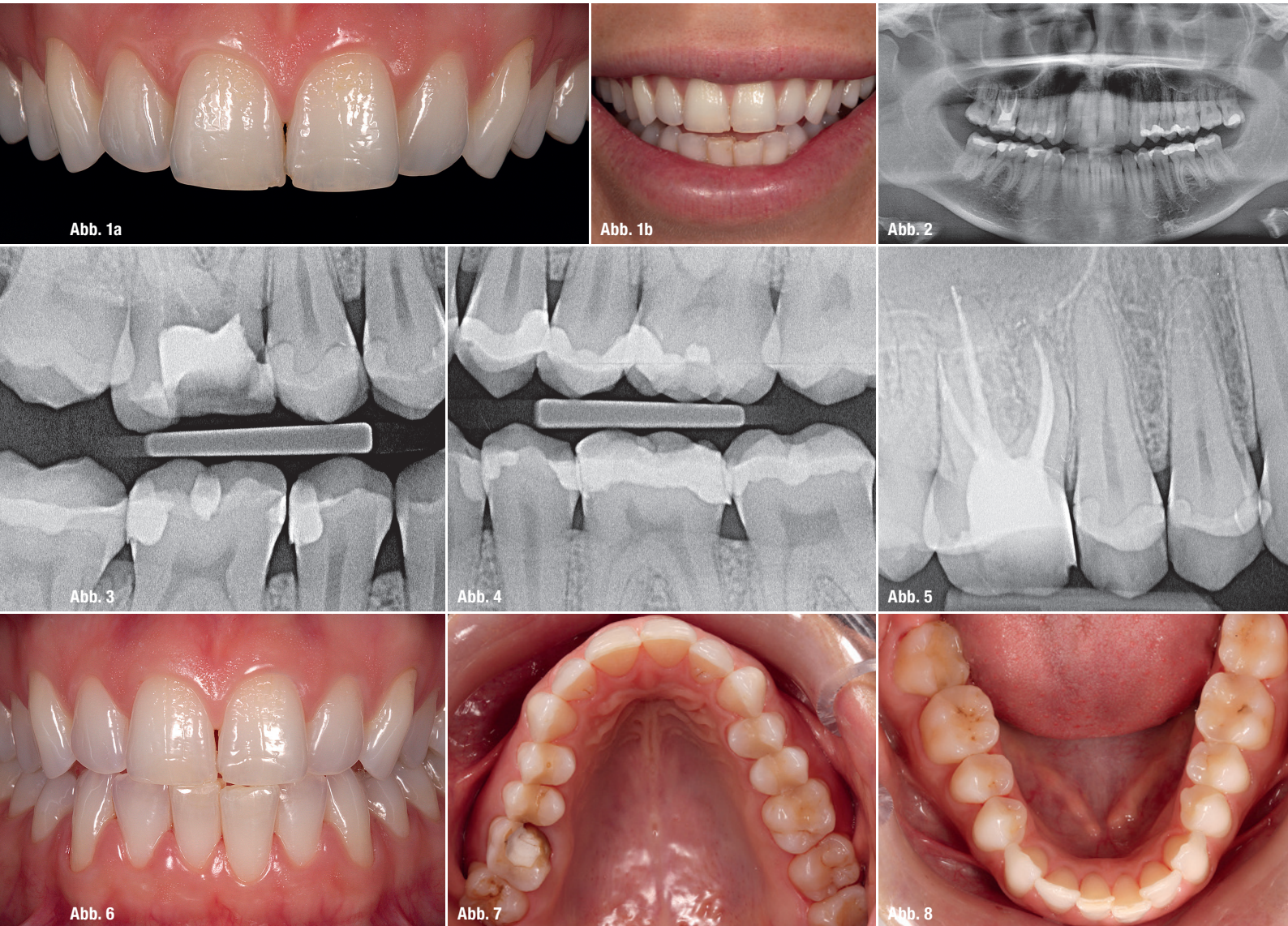
Abb. 1a und b: Der klinische Befund: rote Ästhetik. Abb. 2: OPT: Kein Anhalt auf nicht zahnverursachte Prozesse, elongierter Zahn 28, apikale Aufhellung an Zahn 16. Abb. 3 und 4: Die Bissflügel aufnahmen: Karies an Zahn 16 mes. CIII, Randspalten der Zähne 15, 14, 24, 25 und 26 mes. u. dis., Füllungsüberschüsse an den Zähnen 36 dis., 45, 46 dis. Abb. 5: Zahnfilm 16, überstopfte Wurzelfüllung (dicht und blasenfrei). Abb. 6: Die Front in Okklusion. Abb. 7 und 8: Der Ober- und Unterkieferaufbiss.

21 und 22, eine insuffiziente Wurzelfüllung an 16 mit apikaler Aufhellung und ein prothetisch und konservierend insuffizient versorgtes Erwachsenenengebiss. Zudem finden sich funktionell Locked Occlusion (steile Höcker), eine leichte Myopathie rechts, eine Störung der dynamischen Okklusion (ungenügende Eckzahnführung, Elongation 28), Schmelzabspaltungen sowie Facetten (Attritionen Oberkiefer-/Unterkiefer-Frontzahnbereich, Latero- und Protrusionsfacetten Front- und Seitenzahnbereich).