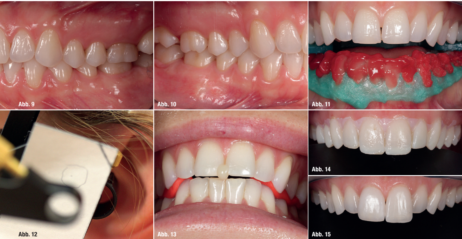
Abb. 9 und 10: Die Rechts-/Links-Okklusion. Abb. 11: Das In-Office-Bleaching. Abb. 12: Die Axiografie. Abb. 13: Die Zentribissnahme. Abb. 14: Mock-up der Zähne 13–23 mit Silikonsschlüssel (gefertigt auf Wax-up-Modell). Abb. 15: Die Testveneeranprobe an den Zähnen 11 und 21.