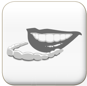
zischow ALIGNER always the next level.