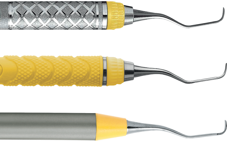
Abb. 2: Die EverEdge 2.0-Instrumente gibt es wahlweise mit Diamant-Rändel-Griff, mit Kunstharzgriff in acht verschiedenen Farben oder mit CCH-Griff.

Im Sortiment der Gracey-Serie gibt es die Mini-Five- und After-Five-Instrumente. Für welche Bereiche eignen sich diese Küretten am besten?