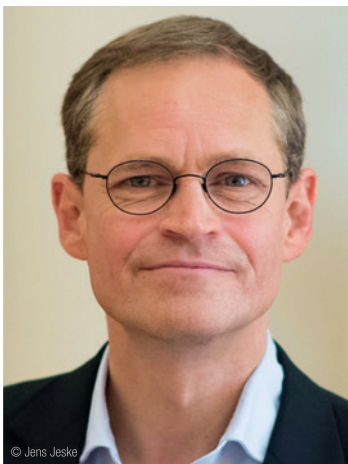
Michael Müller Regierender Bürgermeister von Berlin

Herzlich willkommen zur Dentalfachmesse id infotage dental Berlin. Es ist schön, dass Sie da sind.