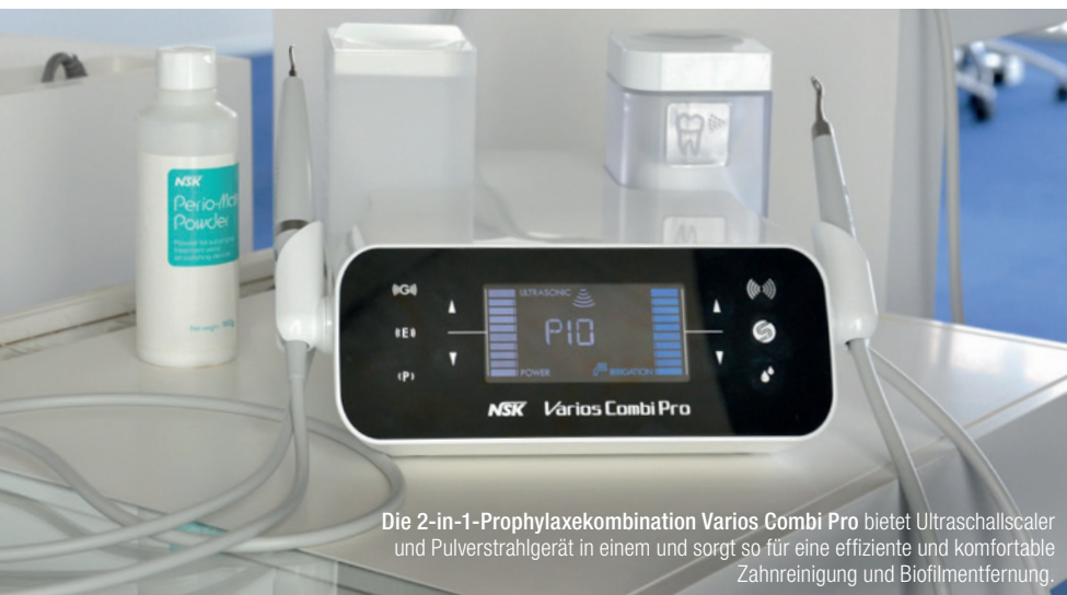
Die 2-in-1-Prophylaxekombination Varios Combi Pro bietet Ultraschallscaler und Pulverstrahlgerät in einem und sorgt so für eine effiziente und komfortable Zahnreinigung und Biofilmentfernung.