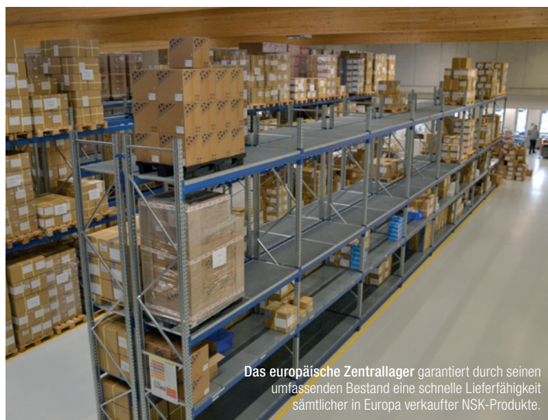
Das europäische Zentrallager garantiert durch seinen umfassenden Bestand eine schnelle Lieferfähigkeit sämtlicher in Europa verkaufter NSK-Produkte.

weise war sieben Jahre zuvor in weiser Voraussicht das Nachbargrundstück gleich mit erworben worden, sodass nun genug Raum für eine Erweiterung des Firmengebäudes zur Verfügung stand. Im Zuge dessen wurde die Lagerfläche noch einmal vervierfacht, um dem gestiegenen Bedarf an NSK-Produkten in Europa gerecht zu werden. Nicht zuletzt durch die Aufnahme großvolumiger Produkte, wie z.B. Sterilisatoren, ins Sortiment wurde der Ausbau des Lagers notwendig. Die Fertigstellung des Neubaus erfolgte im Sommer 2016, seither werden beide Bereiche zusammenhängend genutzt.