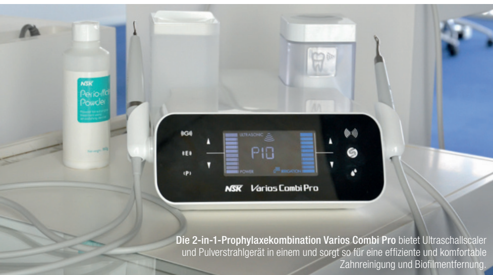
Die 2-in-1-Prophylaxekombination Varios Combi Pro bietet Ultraschallscaler und Pulverstrahlgerät in einem und sorgt so für eine effiziente und komfortable Zahnreinigung und Biofilmentfernung.