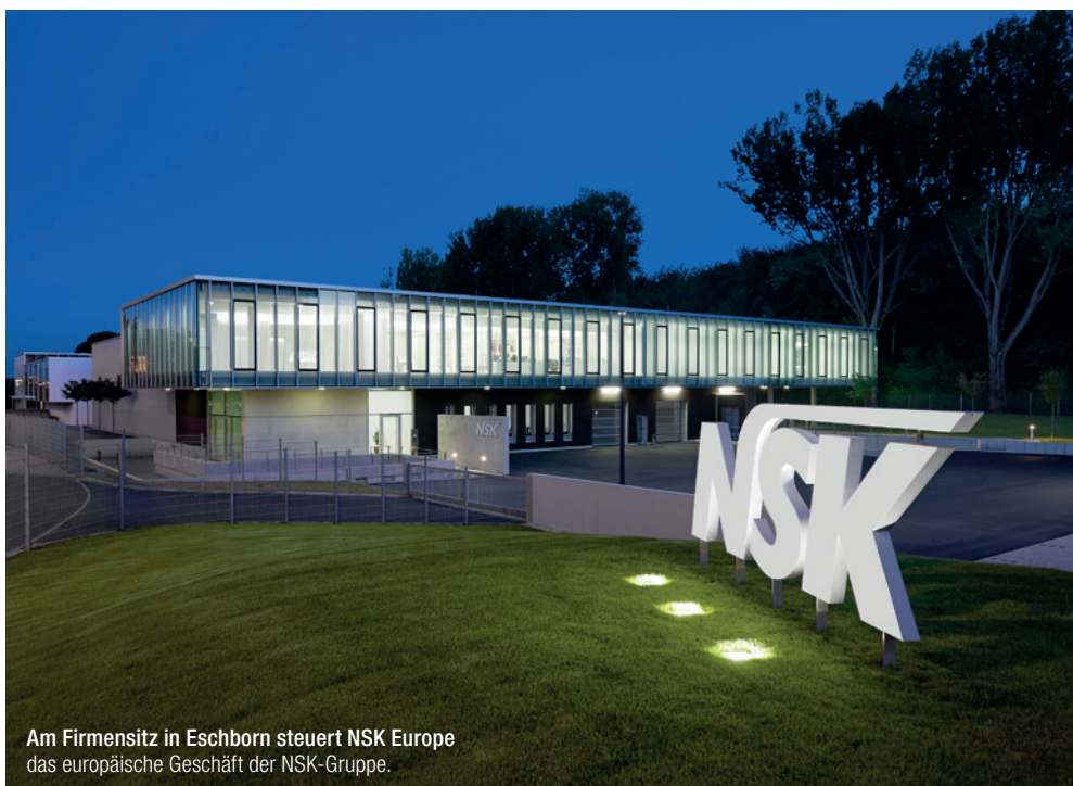
Am Firmensitz in Eschborn steuert NSK Europe das europäische Geschäft der NSK-Gruppe.

Im Jahr 2003, zum damaligen Zeitpunkt bereits auf über 70 Jahre Entwicklungserfahrung zurückblickend, gründete die Nakanishi Inc. eine Niederlassung in Deutschland mit dem Ziel, mit hochwertigen Produkten und einem überzeugenden Preis-Leistungs-Verhältnis den europäischen Dentalmarkt zu erobern. Dieser Entscheidung lagen nicht nur große Pläne zugrunde, sondern auch ein gesundes Selbstbewusstsein: Die größten europäischen Mitbewerber waren in und um Deutschland angesiedelt. Dieser Konkurrenz-situation sollte sich die europäische Niederlassung von Beginn an stellen, um an den Herausforderungen zu wachsen und sich langfristig einen stabilen Platz am Markt zu sichern. Dabei fiel der Anfang sprichwörtlich eher klein aus – nur eine Handvoll Mitarbeiter und ein im Vergleich zum heutigen Stand eng gefasstes Produktsortiment starteten in Frankfurt-Rödelheim die europäische Niederlassung.