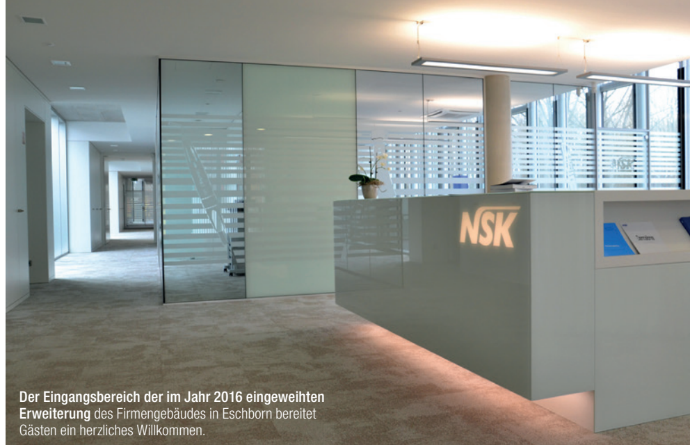
Der Eingangsbereich der im Jahr 2016 eingeweihten Erweiterung des Firmengebäudes in Eschborn bereitet Gästen ein herzliches Willkommen.

Die weiterhin dynamische Entwicklung von NSK Europe führte zu fortschreitendem Wachstum des Unternehmenszweigs – und so wurde im Jahr 2015 erneut der Platz knapp. Glücklicher-