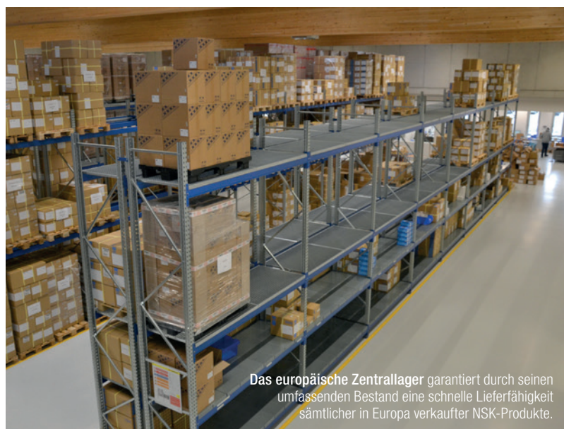
Das europäische Zentrallager garantiert durch seinen umfassenden Bestand eine schnelle Lieferfähigkeit sämtlicher in Europa verkaufter NSK-Produkte.

weise war sieben Jahre zuvor in weiser Voraussicht das Nachbargrundstück gleich mit erworben worden, sodass nun genug Raum für eine Erweiterung des Firmengebäudes zur Verfügung stand. Im Zuge dessen wurde die Lagerfläche noch einmal vervierfacht, um dem gestiegenen Bedarf an NSK-Produkten in Europa gerecht zu werden. Nicht zuletzt durch die Aufnahme großvolumiger Produkte, wie z.B. Sterilisatoren, ins Sortiment wurde der Ausbau des Lagers notwendig. Die Fertigstellung des Neubaus erfolgte im Sommer 2016, seither werden beide Bereiche zusammenhängend genutzt.