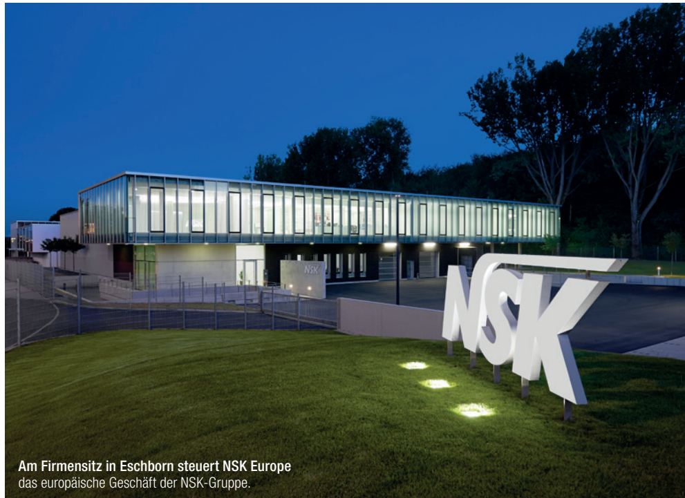
Am Firmensitz in Eschborn steuert NSK Europe das europäische Geschäft der NSK-Gruppe.

Im Jahr 2003, zum damaligen Zeitpunkt bereits auf über 70 Jahre Entwicklungserfahrung zurückblickend, gründete die Nakanishi Inc. eine Niederlassung in Deutschland mit dem Ziel, mit hochwertigen Produkten und einem überzeugenden Preis-Leistungs-Verhältnis den europäischen Dentalmarkt zu erobern. Dieser Entscheidung lagen nicht nur große Pläne zugrunde, sondern auch ein gesundes Selbstbewusstsein: Die größten europäischen Mitbewerber waren in und um Deutschland angesiedelt. Dieser Konkurrenz-situation sollte sich die europäische Niederlassung von Beginn an stellen, um an den Herausforderungen zu wachsen und sich langfristig einen stabilen Platz am Markt zu sichern. Dabei fiel der Anfang sprichwörtlich eher klein aus – nur eine Handvoll Mitarbeiter und ein im Vergleich zum heutigen Stand eng gefasstes Produktsortiment starteten in Frankfurt-Rödelheim die europäische Niederlassung.