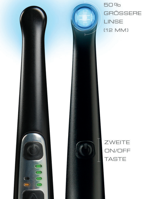
Die neue Polymerisationsleuchte VALO® Grand sorgt für Komfort und Sicherheit bei Zahnarzt und Patient.