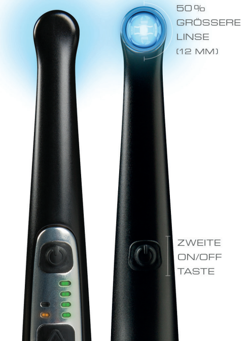
Die neue Polymerisationsleuchte VALO® Grand sorgt für Komfort und Sicherheit bei Zahnarzt und Patient.