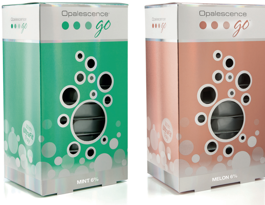
Das Erfolgsprodukt Opalescence Go® für die professionelle Zahnaufhellung zu Hause.