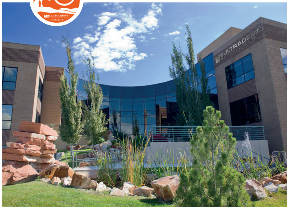
Der Firmensitz von Ultradent Products befindet sich in South Jordan, Utah, etwa eine halbe Auto-stunde von Salt Lake City entfernt.