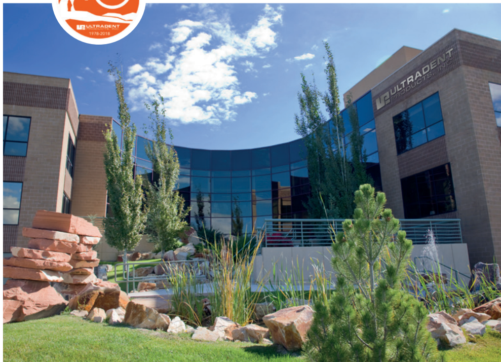
Der Firmensitz von Ultradent Products befindet sich in South Jordan, Utah, etwa eine halbe Auto-stunde von Salt Lake City entfernt.