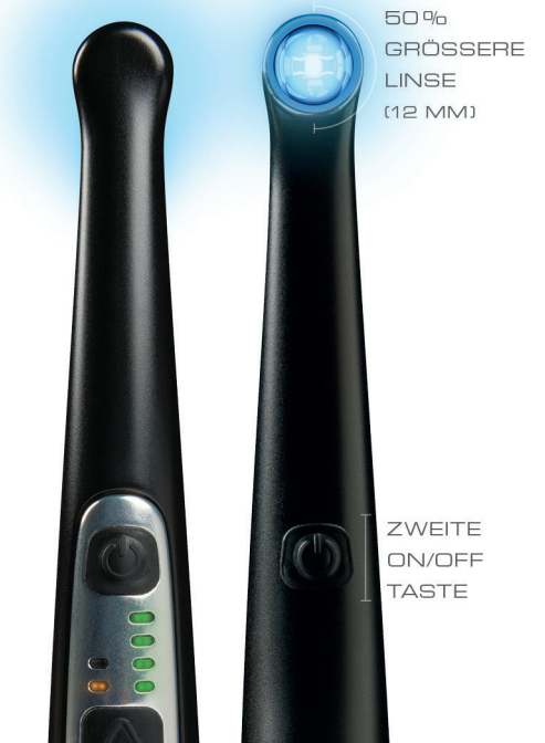
Die neue Polymerisationsleuchte VALO® Grand sorgt für Komfort und Sicherheit bei Zahnarzt und Patient.