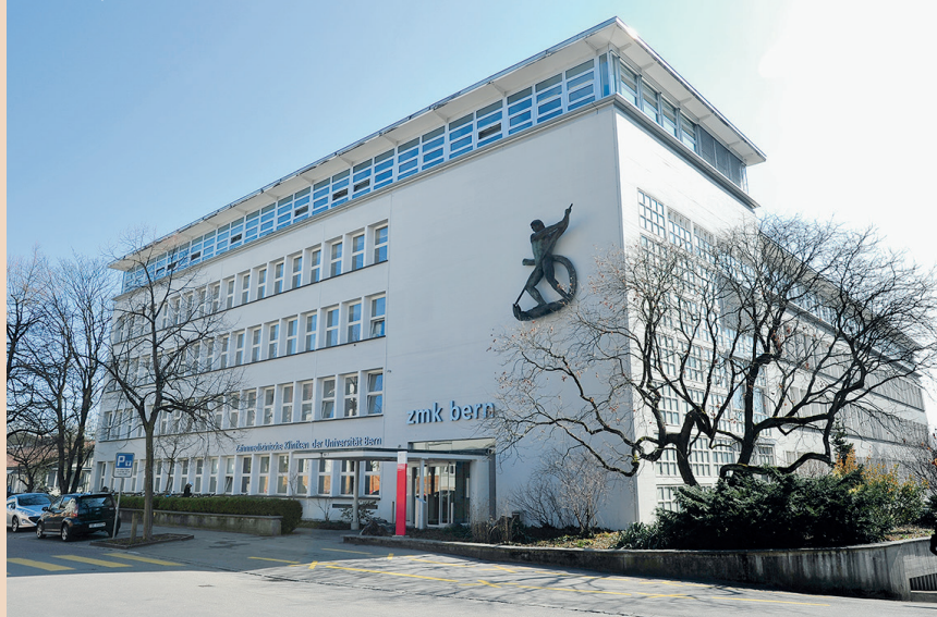
Die Zahnmedizinischen Kliniken der Universität Bern.

Bei dem weltweiten Ranking der Universitäten werden insgesamt 48 Fachbereiche beurteilt – Zahnmedizin ist einer davon. Für die Be-