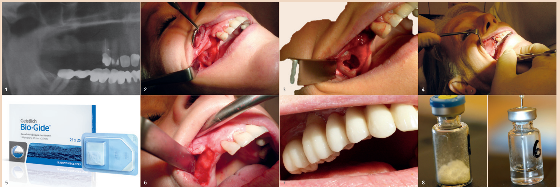
Abb. 1: OPG bei Erstanamnese. – Abb. 2–4: Zehn Jahre Osteomyelitis OK (9/2006). – Abb. 5: Abdeckmembran von Bio-Gide®. – Abb. 6: 16 Monate nach OP (2/2008)... – Abb. 7: ... mit Brücke (Hybrid). Diese Patientin ist seit 2008 komplett metallfrei (Zirkondioxid) und mit einer festsitzenden Brücke versorgt. Implantate und Brücke sind metallfrei. – Abb. 8: inductOs® + Flüssigkeit.

Diese Patientin ist seit 2008 komplett metallfrei (Zirkondioxid) und mit einer festsitzenden Brücke versorgt (Abb. 9a und 9b). Implantate und Brücke sind metallfrei.