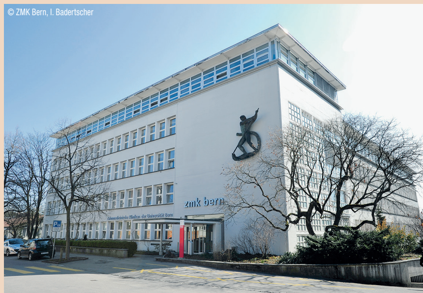
Die Zahnmedizinischen Kliniken der Universität Bern.

Für die deutschen Universitäten sieht es innerhalb des Rankings nicht ganz so gut aus. Lediglich die Ludwig-Maximilians-Universität München taucht unter den TOP 50 in dem welt-