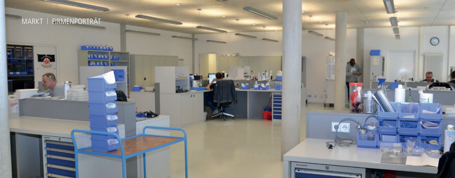
Abb. 5: Service wird bei NSK großgeschrieben: Die haus eigene Reparaturwerkstatt punktet durch Präzision und Kompetenz.

eigenen Servicewerkstatt: Alles ist akkurat, sauber und aufgeräumt.“ Dies werde auch im japanischen Hauptquartier so vorgelebt und spiele vor allem deshalb eine so große Rolle, da die vertriebenen Produkte in sensiblen medizinischen Bereichen eingesetzt werden und ihr fehlerfreies Funktionieren für Anwender sowie Patienten größte Relevanz hat. Die Wertschätzung dieser verantwortungsvollen Aufgabe ist im gesamten Unternehmen spürbar.