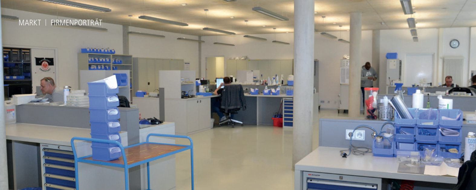
Abb. 5: Service wird bei NSK großgeschrieben: Die haus eigene Reparaturwerkstatt punktet durch Präzision und Kompetenz.

eigenen Servicewerkstatt: Alles ist akkurat, sauber und aufgeräumt.“ Dies werde auch im japanischen Hauptquartier so vorgelebt und spiele vor allem deshalb eine so große Rolle, da die vertriebenen Produkte in sensiblen medizinischen Bereichen eingesetzt werden und ihr fehlerfreies Funktionieren für Anwender sowie Patienten größte Relevanz hat. Die Wertschätzung dieser verantwortungsvollen Aufgabe ist im gesamten Unternehmen spürbar.