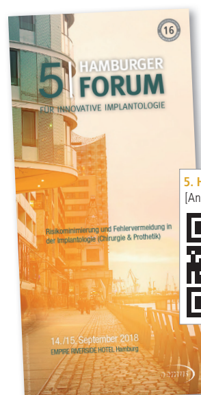
5. Hamburger Forum [Anmeldung/Programm]