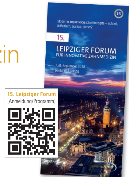
15. Leipziger Forum [Anmeldung/Programm]

Als besonderes Highlight widmet sich das Gemeinschaftspodium am Samstagnachmittag unter der Themenstellung „Von der Blickdiagnose zum komplizierten Fall“ interdisziplinären Fragestellungen bei der Befunderhebung. Speziell geht es darum, wie der Behandler in der täglichen Praxis aufgrund seiner Erfahrung und visuellen Befunde, im Zuge der klinischen Untersuchung typische Symptome herausfinden kann, aus denen sich letztlich die Diagnose