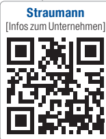
Straumann [Infos zum Unternehmen]

Your smartphone is now able to capture tooth movements and communicate them to your orthodontist. Dental Monitoring allows your orthodontist to remotely control your treatment, warning your doctor of changing conditions as they occur. This makes your Orthodontic treatment faster and more efficient with fewer appointments required.