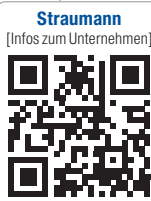
Straumann [Infos zum Unternehmen]

Your smartphone is now able to capture tooth movements and communicate them to your orthodontist. Dental Monitoring allows your orthodontist to remotely control your treatment, warning your doctor of changing conditions as they occur. This makes your Orthodontic treatment faster and more efficient with fewer appointments required.