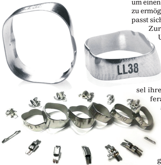
Ab sofort können KFO-Praxen den Bänderaltbestand-Vermessungsservice von Adenta nutzen und schnell und unkompliziert auf deren in Deutschland gefertigte Qualitätsbänder umsteigen.

Haben wir Sie neugierig gemacht? Dann bewerben Sie sich jetzt online unter www.3m.de/Karriere // Kennung: R00931093