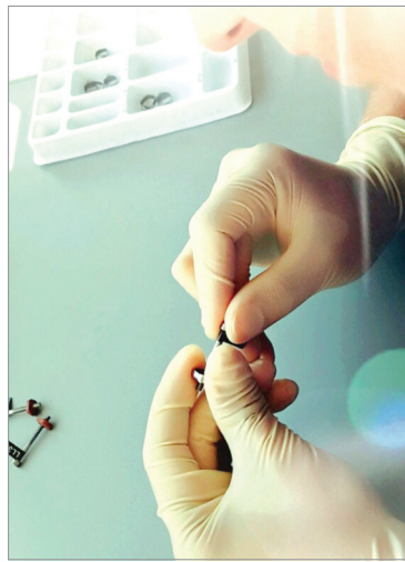
Einfach Muster des bisherigen Lagerbestandes einschicken, kostenlos vermessen lassen und direkt und ohne Mindestbestellmenge zu Molarenbändern aus dem Hause Adenta wechseln.

Maßgeschneidert und auf die wirklichen Bedürfnisse abgestimmt, stattet das Unternehmen die Praxen mit seinen Qualitätsprodukten „made in Germany“ aus. Und das ohne Mindestabnahme für alle gängigen Verbrauchsprodukte (z. B. Bänder, Drähte, Kleberöhrchen, Elastics). Somit wird nur das bestellt, was