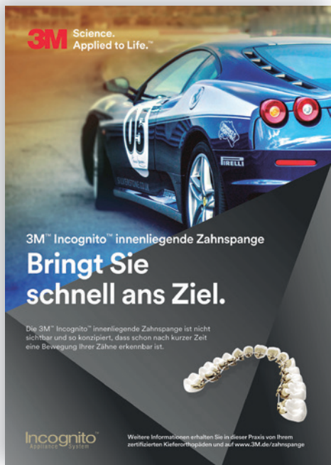
Neu: Poster für die Incognito-Patientenaufklärung.

3M und Incognito sind Marken der 3M Company.