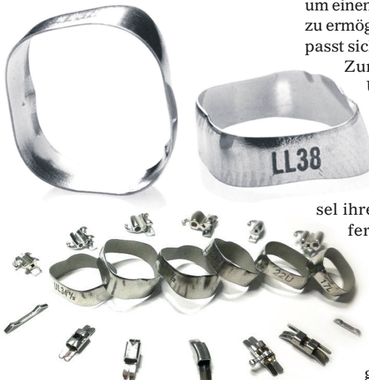
Ab sofort können KFO-Praxen den Bänderaltbestand-Vermessungsservice von Adenta nutzen und schnell und unkompliziert auf deren in Deutschland gefertigte Qualitätsbänder umsteigen.

Haben wir Sie neugierig gemacht? Dann bewerben Sie sich jetzt online unter www.3m.de/Karriere // Kennung: R00931093