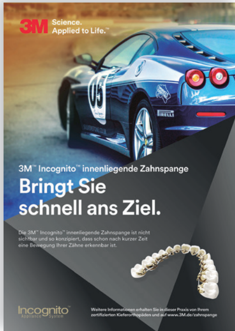
Neu: Poster für die Incognito-Patientenaufklärung.

3M und Incognito sind Marken der 3M Company.