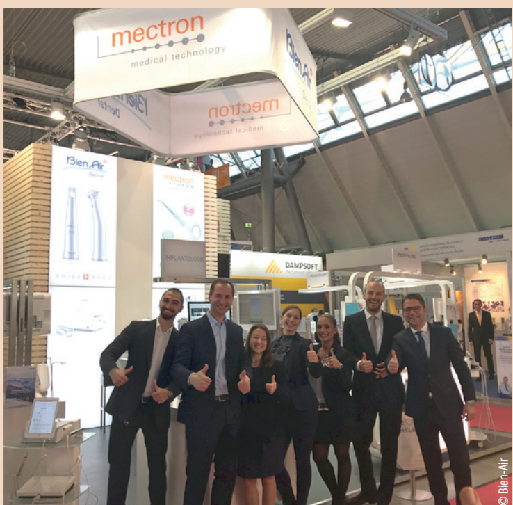
Abb. 3: Daumen hoch für geballte Power beim gemeinsamen Messeauftritt der Vertriebspartner Bien-Air und mectron zur Fachdental Leipzig 2017.

Es erwartet Sie ein hochkarätiges, wissenschaftliches Programm für das gesamte Praxisteam in Oktoberfest-Atmosphäre!