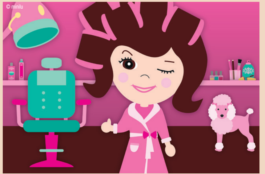
Eine Beauty Lounge und mehr bei minilu.at auf der WID.