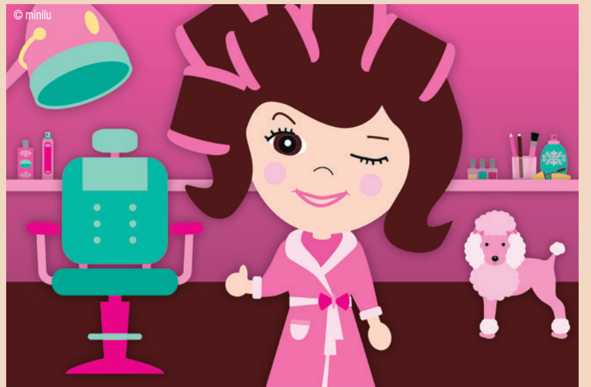
Eine Beauty Lounge und mehr bei minilu.at auf der WID.

auf Rechnung. Geliefert wird innerhalb von 24 Stunden, etwaige Retouren werden schnell und einfach abgewickelt – schließlich möchte minilu nicht nur mit den mini Preisen, sondern auch mit bestem Service Maßstäbe setzen. DT