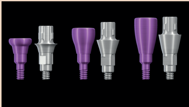
Patientenindividuelles Weichgewebemanagement kann so einfach sein – mit Straumann® Variobase® Klebebasen und den passenden Gingivaformern.

Eine erfolgreiche Weichgewebekonditionierung ist entscheidend