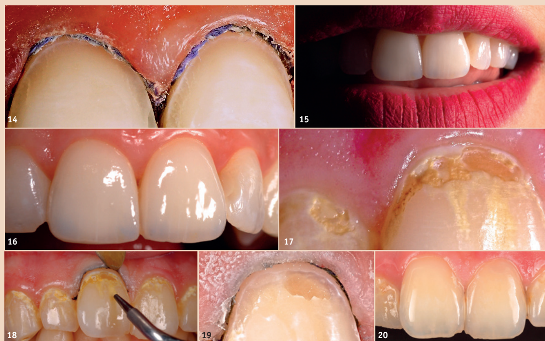
Abb. 13 und 14: Die Aufnahmen beim Zementierungstermin vor und nach dem Sandstrahlen zeigen die Effizienz der Partikelstrahltechnologie. – Abb. 15: Das aufwandarme Verfahren sorgt für besonders saubere Zahnoberflächen. – Abb. 16: Zwei Jahre später – die Klebefuge bleibt sauber vor Kontaminationen und Verfärbungen. – FALL 3 Abb. 17: Patient mit z. T. ausgedehnten zervikalen Schmelz- und Dentinerosionen der oberen Front- und Eckzähne. – Abb. 18: Präzise Anwendung eines Sandstrahlers mit feiner Düse unter dem Mikroskop ermöglicht die besonders konservative Entfernung des Biofilms und der weichen Dentinareale. – Abb. 19: Nach Beenden des Sandstrahlvorgangs verbleibt ein optimal konditioniertes Zahnszubstrat zum Ätzen und Bonden. – Abb. 20: Mit Flow Composite erhält man schnell und unkompliziert eine dauerhafte zervikale Kompositfüllung.

Tsimiski 95 Thessaloniki, 54622 Griechenland kleanthis@manolakis.net