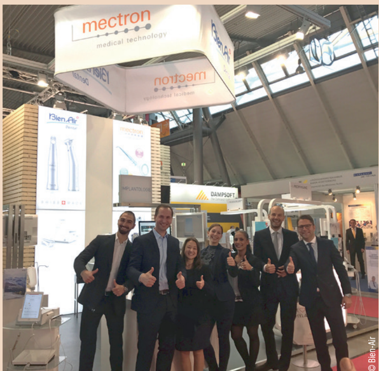
Abb. 3: Daumen hoch für geballte Power beim gemeinsamen Messeauftritt der Vertriebspartner Bien-Air und mectron zur Fachdental Leipzig 2017.