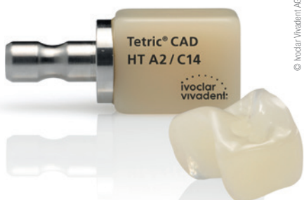
* Tetric CAD: Neuer Composite-Block für effiziente, ästhetische Restaurationen.

Ivoclar Vivadent GmbH Tel.: +43 1 26319110 www.ivoclarvivadent.at Stand C35 D05