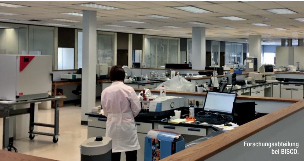
Forschungsabteilung bei BISCO.