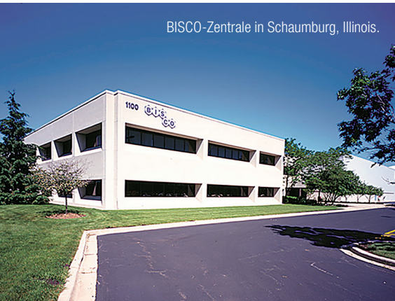
BISCO-Zentrale in Schaumburg, Illinois.

gewinn für die bisherige Angebotspalette. 1981 gegründet, hat sich BISCO besonders dem wissenschaftlichen Aspekt innerhalb der Zahnheilkunde verschrieben und forscht fortwährend an neuen Produktentwicklungen. Davon profitieren ab sofort auch die Kunden von ADSystems, die von nun an unter anderem das lichthärtende Universal-Adhäsiv All-Bond Universal®, den kunststoffmodifizierten Kalzium-