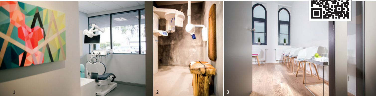
Abb. 1: Cheerful Patterns: Experimentierfreude, Variantenreichtum und zwanglose Kombinationen kennzeichnen diesen jungen Stilmix. Charakteristisch für diese Trendwelt sind gefällige Designs mit kräftigen Farben. – Abb. 2: Honest Materials: Hochwertige natürliche Materialien mit Designanspruch halten bei diesem Trend Traditionelles lebendig. Das Ambiente verbindet progressives, filigranes Design mit authentischen, hochwertigen und langlebigen Materialien. Die Natur ist hier maßgebende Inspiration. – Abb. 3: Embellished Elegance: Dieser Stil vereint dekorativ-glamouröse Aspekte und innovatives Produktdesign. Weiße Hochglanzoberflächen stehen neben einer klassisch edlen Wand- und Einrichtungsgestaltung.