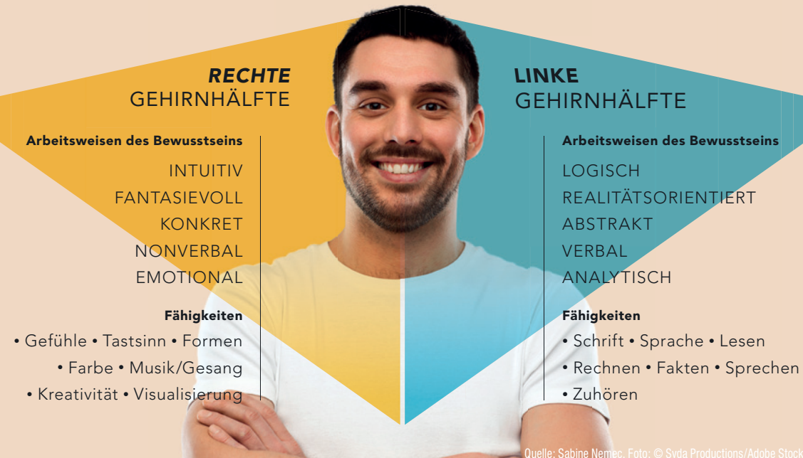
Die Funktionsweisen unserer beiden Gehirnhälften.

wirkungsvoll. Verschiedene Mittel können hierbei zum Einsatz kommen, um Emotionen zu wecken. Auf der visuellen Ebene sind das beispielsweise Bilder, Videos, Logos, die Farbenwelt, Bildkonzepte, Illustrationen – diese entfalten ihre Wirksamkeit insbesondere dann, wenn sie einzigartig sind. Wenn die Praxis für ihren Auftritt etwa zu lachenden Menschen greift, dann sollten diese so gewählt sein, dass sie eine relevante und spannende Botschaft vermitteln, gerne auch in Kombination mit Text. Wörter wiederum entfalten ihre Wirkung mehr durch die Bilder, die sie hervorrufen, als durch das Wort selbst. Zusammen sollte alles einen angenehmen emotionalen Zustand erzeugen, der dann mit Ihrer Praxis verknüpft wird. Alles kommuniziert schließlich etwas. Bleibt jetzt nur zu fragen: Welcher Eindruck und welche Emotion sollen mit Ihrer Praxis verbunden werden? DI