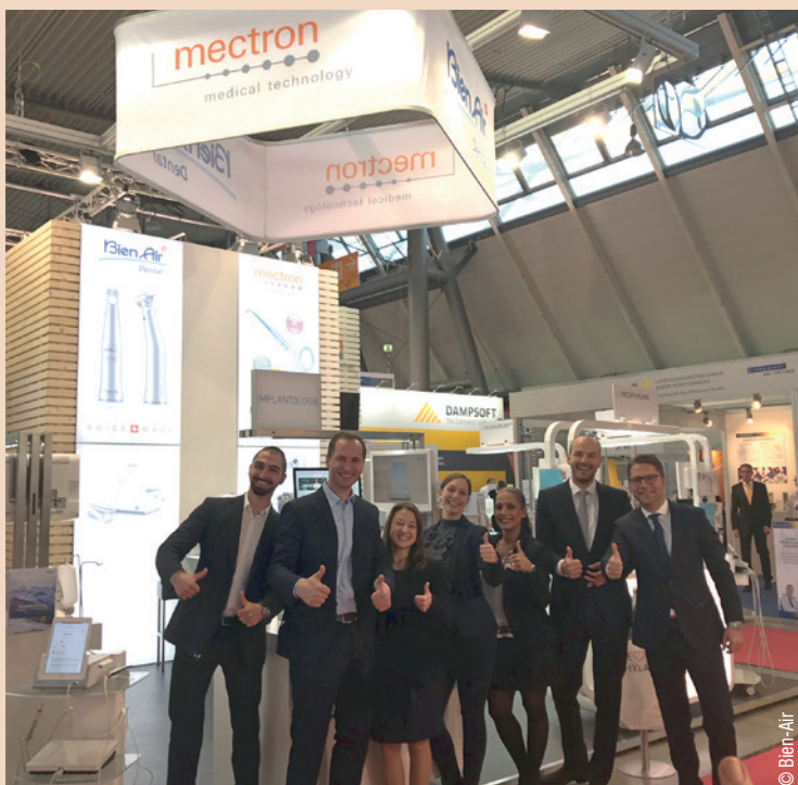
Abb. 3: Daumen hoch für geballte Power beim gemeinsamen Messeauftritt der Vertriebspartner Bien-Air und mectron zur Fachdental Leipzig 2017.