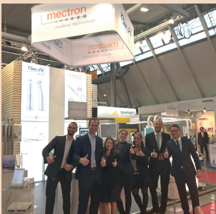
Abb. 3: Daumen hoch für geballte Power beim gemeinsamen Messeauftritt der Vertriebspartner Bien-Air und mectron zur Fachdental Leipzig 2017.

Es erwartet Sie ein hochkarätiges, wissenschaftliches Programm für das gesamte Praxisteam in Oktoberfest-Atmosphäre!