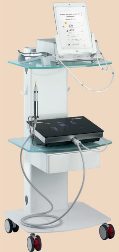
Abb. 2: Das Chirurgiegerät iChiropro (Bien-Air) und das Piezosurgery-Gerät (mectron) auf dem praktischen Cart.