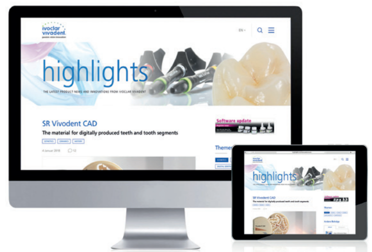
Das neue Highlights-Portal von Ivoclar Vivadent.

Wie der bereits existierende Blog ist auch das neue Produktportal in den fünf Sprachen Englisch, Deutsch, Italienisch, Französisch und Spanisch verfügbar. Ausserdem gibt es auch hier eine Unterteilung gemäss den