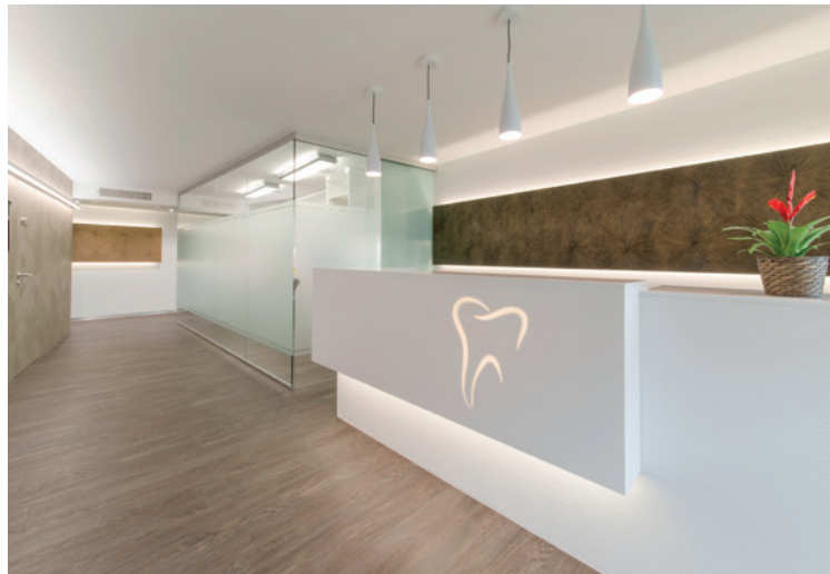
Links: Empfangsfront mit Strukturplatte MDF weiss lackiert und Abdeckung in Corian® Design Glacier White 12 mm mit eingefrästem Logo. Rechts: Empfang vor dem Umbau.

Bei Häubi AG ist die Symbiose zwischen den Innenarchitekten und der Schreinerei eine perfekte Zusammenarbeit. Der Innenarchitekt entwirft den Empfang im 3D-CAD und der Schreiner setzt dieses gekonnt im 3D-CAD weiter um. Beide interessieren heute weder Winkel noch Rundungen, denn der Schreiner übernimmt eins zu eins die 3-D-Daten der Innenarchitekten und setzt diese in Produktionspläne um. Mit dem 5-Achsen-CNC-Bearbeitungszentrum