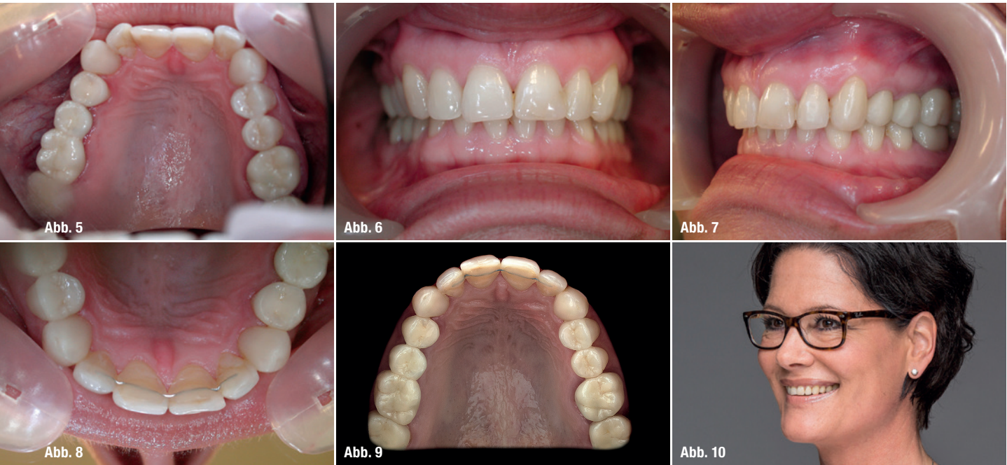
Abb. 5: Die Ausgangssituation in intraoraler Betrachtung. Abb. 6–8: Ein Vorteil einer kieferorthopädischen Korrektur ist der Erhalt der natürlichen Zahnmorphologie und Zahnfarbe. Abb. 9: Die Versorgung des Seitenzahnbereichs mit Keramik Table Tops und Vollkeramikkronen. Abb. 10: Die Endsituation nach Abschluss der Behandlung.