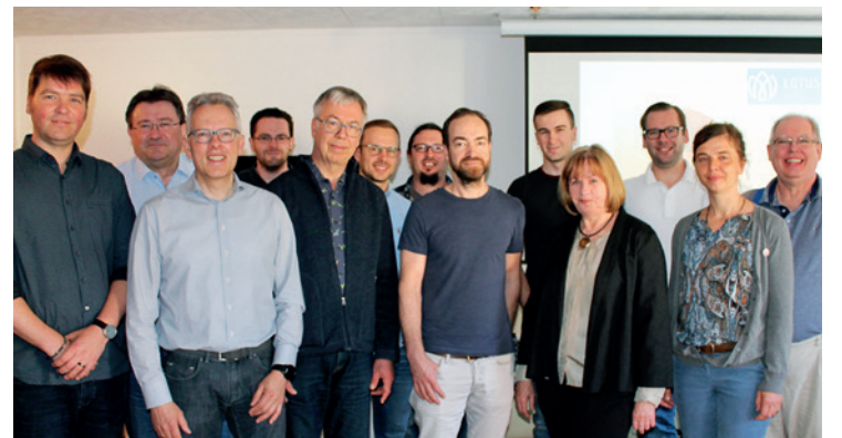
Referenten und Teilnehmer des Masterkurses zum Lotuskonzept bei Dentaltechnik Walther.

Dentaltechnik Walther GmbH Strohhof 5 06246 Bad Lauchstädt Tel.: 034635 29030 Fax: 034635 29031 info@dentaltechnik-walther.de www.dentaltechnik-walther.de