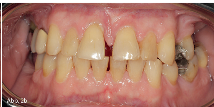
Abb. 2a und b: Amlodipin-induzierte Gingivahyperplasie bei Diabetes mellitus-Patient (vor und zehn Monate nach der Parodontistherapie).

Patienten nach akutem Herzinfarkt, nach Einbringung eines koronalen Stents oder bei Vorhofflimmern. In diesen Fällen oder nach einer Herzoperation sollte die Therapie von einem Zahnarzt durchgeführt werden.