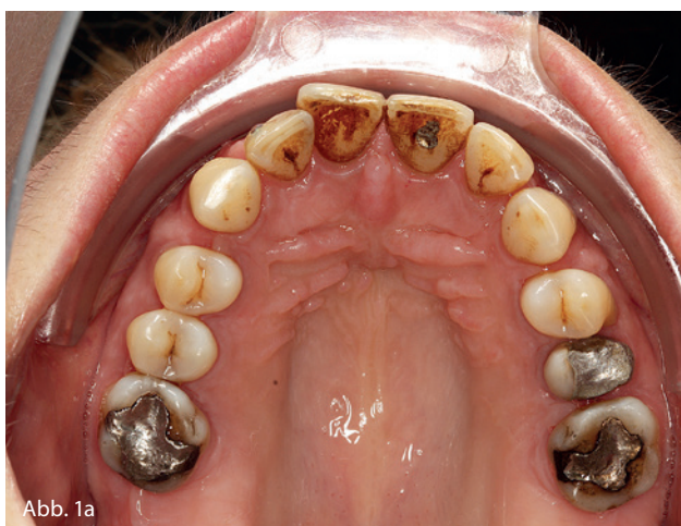
Abb. 1a und b: Ansicht eines Gebisses mit Raucherverfärbung.

vale Blutversorgung 1 , die Zusammensetzung sowie die Fließrate des Speichels 2 und sogar auf den Knochenmetabolismus 3,4 , sodass von einer zeitlich begrenzten Empfindlichkeit für parodontale Erkrankungen sowie Gingivahyperplasien 5 ausgegangen werden kann. Weiterhin gibt es einen Zusammenhang zwischen einer parodontalen Erkrankung und Schwangerschaftskomplikationen. So neigen Frauen mit einer unbehandelten Parodontitis zu Frühgeburten oder Säuglingen mit einem reduzierten Geburtsgewicht. 6 Daher sollte bei Frauen mit Kinderwunsch oder bei bestehender Schwangerschaft ein besonderer Fokus