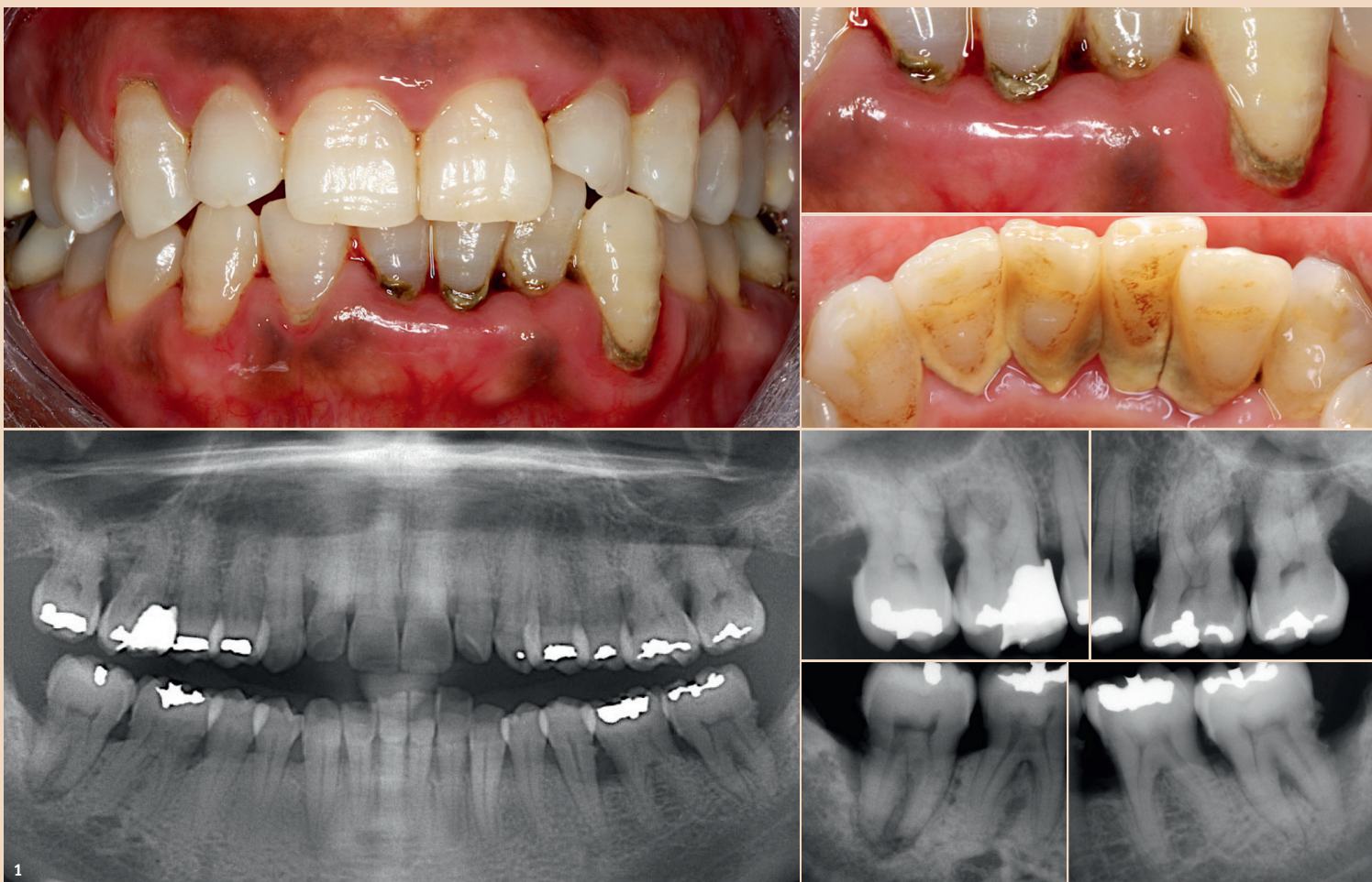
Abb. 1: 47-jährige Patientin mit generalisierter chronischer Parodontitis gravis et complicata. Plaque-, Zahnstein- und Konkrementablagerungen im supra- und subgingivalen Bereich sind auf den klinischen und radiologischen Bildern deutlich erkennbar und als ätiologischer Faktor für das Entstehen der Parodontitis anzusehen.

Lokal verabreichte Produkte im Rahmen der nichtchirurgischen Parodontaltherapie zielen auf eine bessere Infektionskontrolle, reduzierten Gewebeerstörung und/oder eine verbesserte Wundheilung ab. Dies sollte klinisch in einer grösseren Reduktion der Sondierungstiefe, in einem zusätzlichen Gewinn an Attachment sowie in einer verbesserten radiologischen Knochendefektheilung resultieren. Beispielsweise wies die lokale Applikation von Hyaluronsäure als Ergänzung zur nichtchirurgischen Parodontaltherapie zwar einen zusätzlichen Effekt bei der Sondierungstiefenreduktion von 0,2 bis 0,9 mm auf, aber nur einen begrenzten zusätzlichen Effekt im Hinblick auf Attachmentlevel-Gewinn. 11 Betrachtet man die Ergebnisse diverser Übersichtsarbeiten, zeigt sich generell für nichtantibiotische Zusätze im Rahmen der nichtchirurgischen Parodontaltherapie ein zusätzlicher Effekt von 0,2 bis 0,9 mm und 0,1 bis 0,9 mm in Bezug auf Sondierungstiefenreduktion beziehungsweise Attachmentlevel-Gewinn (Chlorhexidin 12,14 , Povidon-Iod 48 , niedrig dosiertes Doxycyclin 49 , Probiotika 15 , diverse Produkte 50 ). Der zusätzliche Effekt nach Statin-Applikation in Bezug auf Sondierungstiefenreduktion, Attachmentlevel-Gewinn