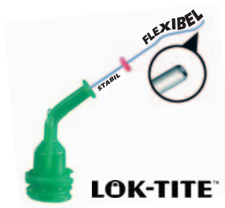
Mit Beflockung zur Reinigung der Kanalwände NaviTips FX / Ø 0,30 mm