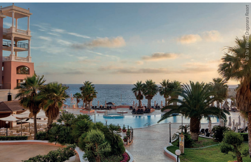
Veranstaltungsort ist das Fünf-Sterne-Hotel The Westin Dragonara Resort in St. Julian's.