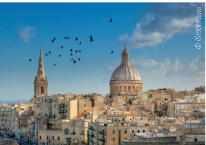
Auf Malta findet vom 20. bis 22. September 2018 der Orthodontic World Congress Europe von Dentsply Sirona Orthodontics statt.

Genießen Sie frisch gefangenen Fisch in kleinen Fischerdörfern voller bunter Fischerboote, erfahren Sie, warum an beinahe jedem Kirchturm auf Malta zwei Zifferblätter angebracht sind, und begeben Sie sich auf Sightseeingtour an beliebte Drehorte der Filmindustrie – beispielsweise wurden auf Malta und seiner kleineren Schwesterninsel Gozo große Teile des Serienhits „Games of Thrones“ gedreht! Und falls Sie dann immer noch Energie haben, empfehlen wir Ihnen das bei Touristen aus aller Welt beliebte Inselhopping: drei Inseln an einem Tag! Von Malta nach Comino und weiter nach Gozo – Wo sonst kann man an einem Tag gleich drei Inseln auf einmal besuchen? Lassen Sie es sich also nicht entgehen, Arbeit, Kultur und Vergnügen in dieser beeindruckenden Atmosphäre perfekt zu kombinieren! Informationen zur Anmeldung finden Sie unter www.owceurope.com