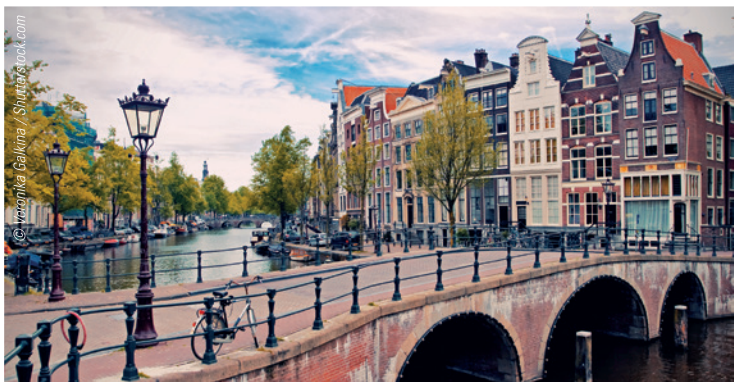
In der Grachtenstadt Amsterdam findet vom 20. bis 22. September 2018 das Insignia Global Users Meeting 2018 statt.

Insignia™-Anwender erhalten vom 20. bis 22. September kompakte Neuigkeiten sowie die perfekte Möglichkeit zum Erfahrungsaustausch mit Kollegen.