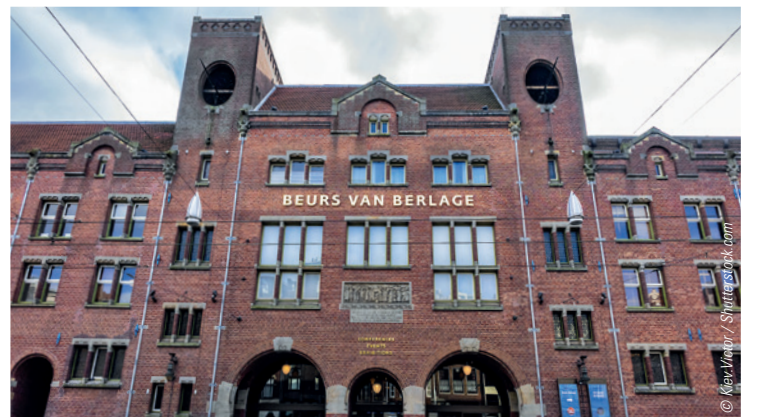
Veranstaltungsort ist die Beurs van Berlage auf dem berühmten Damrak im Zentrum der Stadt.

Für Teilnehmer des Insignia Global Users Meetings empfiehlt Ormco verschiedene, in der Nähe befindliche Hotels, mit denen es Sonder-