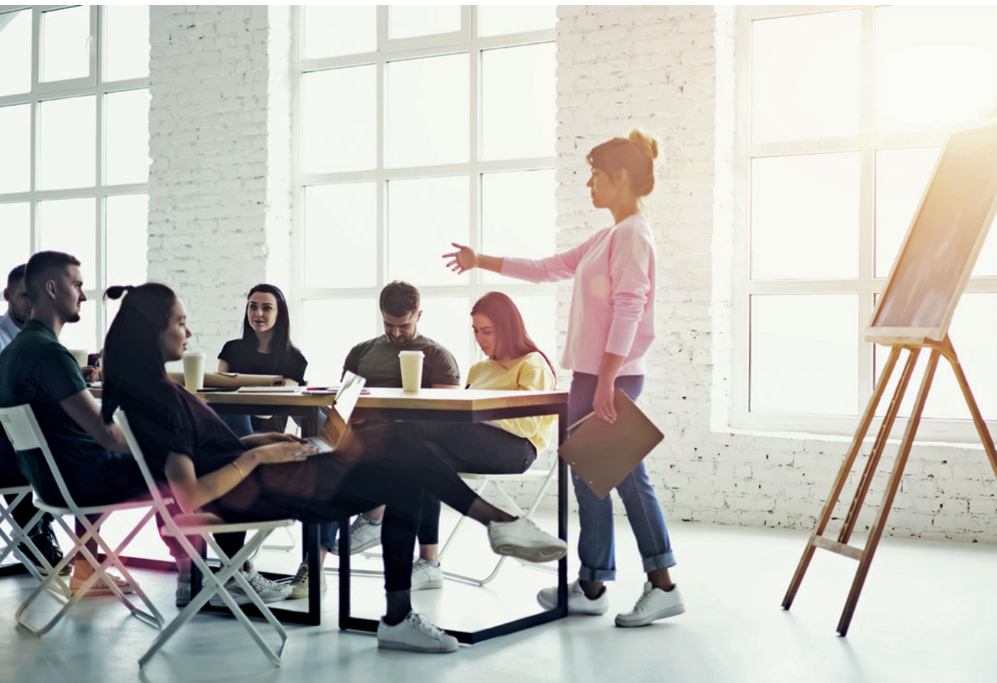
Grafiken: © Gaudilab/Shutterstock.com