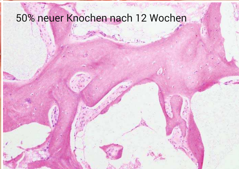
50% neuer Knochen nach 12 Wochen