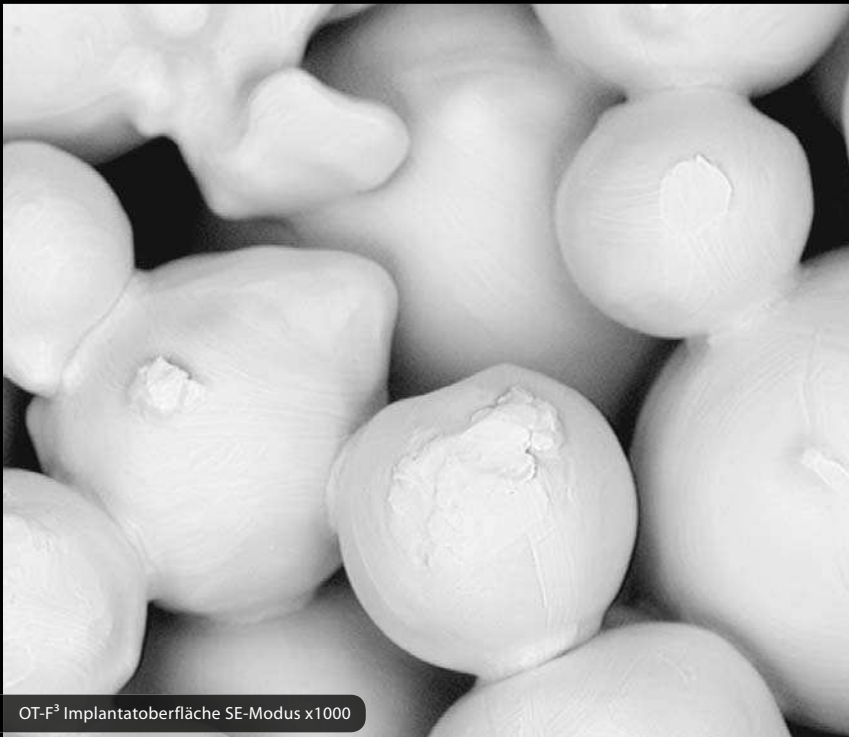
OT-F 3 Implantatoberfläche SE-Modus x1000