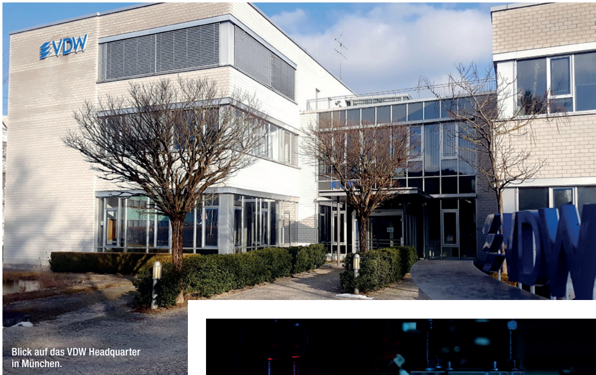
Blick auf das VDW Headquarter in München.

FIRMENPORTRÄT Die Endodontie ist eines der herausforderndsten Fachgebiete der Zahnmedizin mit dem Anspruch, die natürliche Zahnschubstanz zu erhalten. Umso wichtiger ist es daher, dass Generalisten wie Spezialisten sich bei ihrer täglichen Arbeit auf einen versierten Experten, hochwertige Produkte, ein funktionierendes System und entsprechenden Support verlassen können.