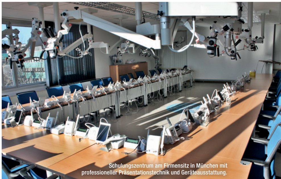
Schulungszentrum am Firmensitz in München mit professioneller Präsentationstechnik und Geräteausstattung.

Die innovative Produktpalette von VDW wird durch umfassende Service- und