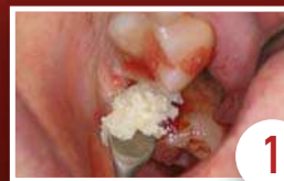
1 Einbringen des gewonnenen Augmentats