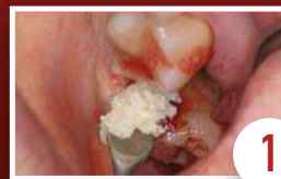
Einbringen des gewonnenen Augmentats