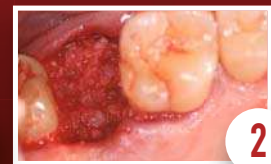
Das eingebrachte Knochenersatzmaterial (KEM)