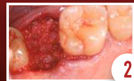
2 Das eingebrachte Knochenersatzmaterial (KEM)