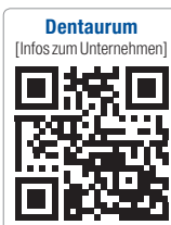
Dentaureum (Infos zum Unternehmen)

Centrum Dentale Communication Turnstraße 31, 75228 Ispringen Tel.: 07231 803-470 Fax: 07231 803-409 kurse@dentaureum.com www.dentaureum.com