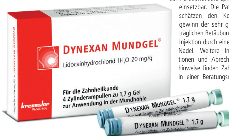
Abb. 1: Das Dynexan Mundgel® aus der Zylinderampulle ist sowohl für Prophylaxe als auch Parodontitistherapie und UPT geeignet.

Schmerzhafte Aphthen gehören zu den häufigsten entzündlichen Veränderungen der Mundschleimhaut. Obwohl sie vom Minortyp meist harmlos sind, können sie intensive Schmerzen verursachen. Für die Selbstmedikation sind rezeptfreie Lokalanästhetika, etwa mit Lidocain, Mittel der ersten Wahl. Diese sind oft schon binnen Sekunden wirksam und sehr gut verträglich. Dynexan Mundgel® wirkt innerhalb von 60 Sekunden. Es zählt in Deutschland seit Jahrzehnten zu den meist empfohlenen Präparaten zur zeitweiligen und symptomatischen Behandlung von Schmerzen in der Mundhöhle, wie z. B. bei Aphthen 2 , Druckstellen, Zahnfleischentzündungen, Lippenherpes und Zahnung. Dank der Formulierung als Monopräparat (Wirkstoff Lidocain) ist es nebenwirkungsarm und verzichtet auf Alkohol, Gluten, Laktose und Zucker. Das Mundgel eignet sich nicht nur für jedes Lebensalter, sondern auch für Patienten mit Unverträglichkeiten.