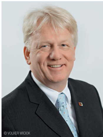
Ullrich Sierau Oberbürgermeister der Stadt Dortmund