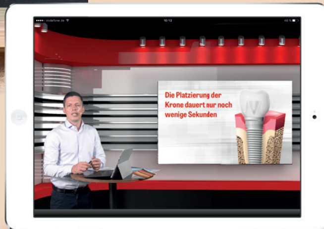
Als brandneues Produkt kommen jetzt die (Live-)Studio Tutorials auf den Markt.

Im IDS-Jahr 2017 erfolgte der fünfte komplette Relaunch von ZWP online, und zum jetzigen Jubiläum präsentiert das Newsportal mit den (Live-)Studio Tutorials einen weiteren Meilenstein in der internetbasierten Fortbildung. Vorträge, Präsentationen, aber auch Diskussionen werden aus mehreren Kameraperspektiven eingefangen und professionell präsentiert. Genutzt wird hier, wie bei den meisten TV-Pro-