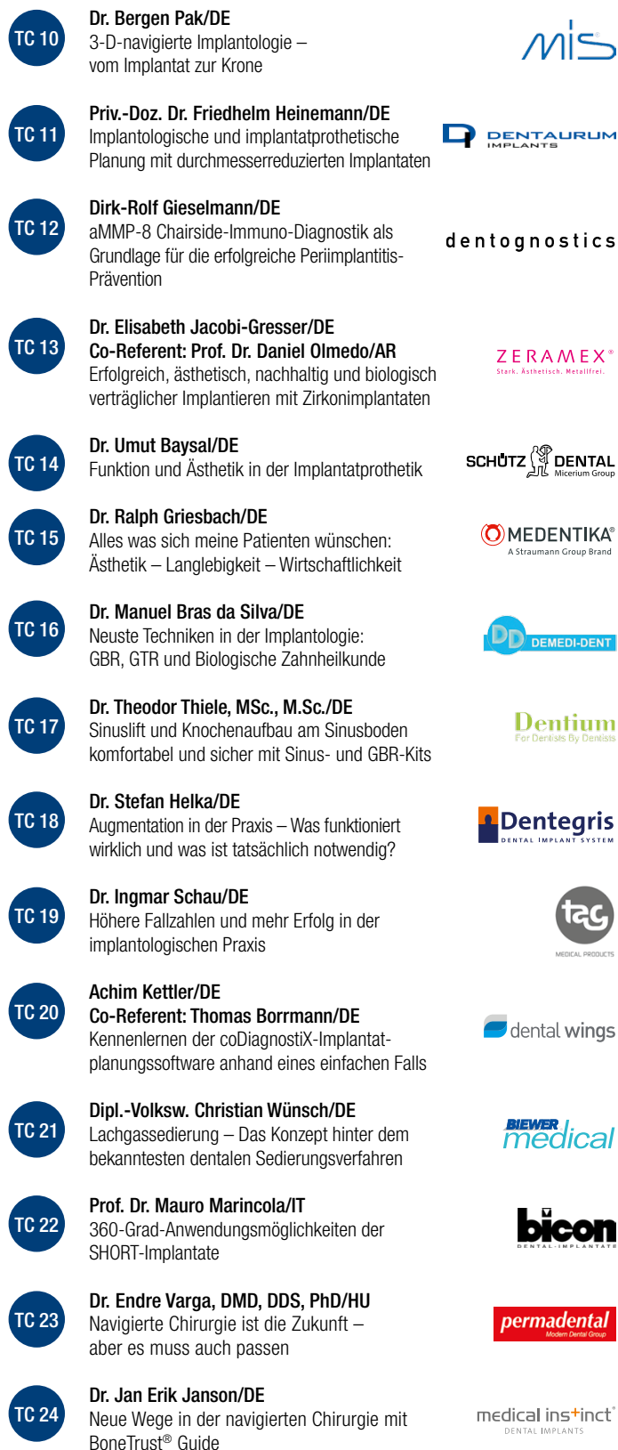
TABLE CLINICS (TC) – Visions in Implantology

18.00 – 21.00 Uhr GET-TOGETHER IM KONGRESS-/AUSSTELLUNGSBEREICH