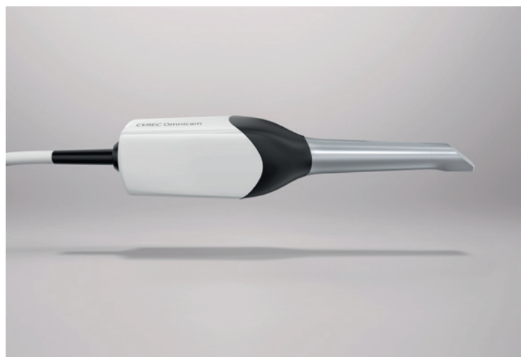
Die CEREC Omnicam von Dentsply Sirona. CAD/CAM versetzt Kieferorthopäden in die Lage, in einem sicheren, geführten Scan ein digitales Modell beider Kiefer zu erstellen.

GAC Deutschland GmbH Bayerwaldstraße 15 81737 München Tel.: 089 540269-0 gacde.info@dentsplysirona.com www.dentsplysirona.com