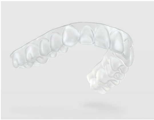
Dentsply Sirona hat OraMetrix übernommen und bietet eine kieferorthopädische Gesamtlösung an, die jetzt für Kunden auch Clear Aligner für den gesamten Kiefer beinhaltet.

Kunden umfassende End-to-End-Lösungen bietet. Ein wichtiger Schritt, um unser gesamtes Portfolio als The Dental Solutions Company zu stärken, war zu Beginn dieses Jahres die Akquisition von OraMetrix, einem Anbieter für innovative 3D-Technologielösungen im Bereich kieferorthopädischer Behand-