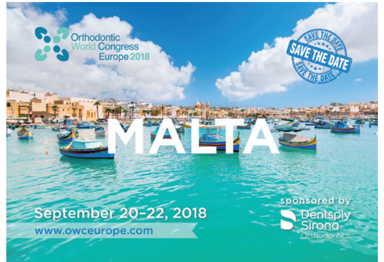
Der Dentsply Sirona Orthodontic World Congress findet vom 20. bis 22. September in Malta statt.

Der Orthodontic World Congress kombiniert praktische Workshops mit Präsentationen von mehr als zwölf internationalen Referenten und einem abendlichen Netzwerk-Event. Der Kongress beginnt am 20. September mit verschiedenen Workshops, bei denen die Teilnehmer aus mehr als sieben unterschiedlichen 50-minütigen Praxiseinheiten wählen können. In den Workshops werden diverse Themen behandelt, von Minor Tooth Movement über das CCO™ System bis hin zu Teammotivation und der Alignertherapie mit Elementrix™ und SureSmile®, einer Lösung von OraMetrix. Am 21. September stehen Vorträge einiger ausgewählter, international angesehener Referenten auf dem Programm, darunter Ärzte wie Univ.-Doz. Dr. Frank Weiland (Mitglied des European Board of Orthodontists und kommissarisches Mitglied der Angle Society of Europe) sowie Dr. Julia Garcia Baeza (Abgesandte des American Board of Orthodontics und Mitglied der Spanish Society of Orthodontics). Die Teilnehmer