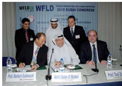
WFLD-Präsident und Vorsitzender der AEEDC Dubai unterzeichnen die Vereinbarung zum WFLD-Kongress 2010.

So wird zum Beispiel 2010 „The World Federation of Laser Dentistry WFLD Dubai Congress“ erstmals gleichzeitig mit der UAE International Dental Conference and Arab Dental Exhibition AEEDC Dubai stattfinden. Der WFLD vertritt weltweit ca. 2.000 Zahnärzte und wird ein wichtiger Bestandteil des Dubai-Kongresses vom 9. bis 11. März 2010 sein.