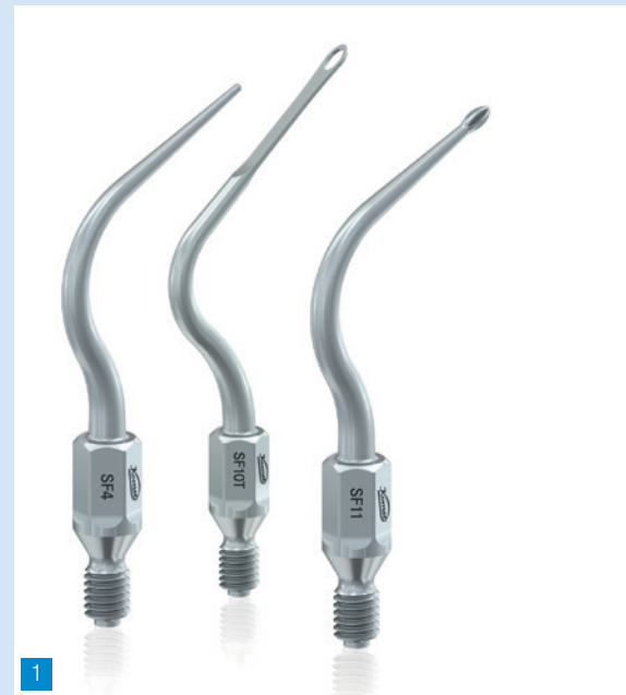
Abb. 1: Paroschulspitze SF4 universal und die ausgeklügelten Formen der SF10T und SF11 für effektives Reinigen besonders schwer zugänglicher Bereiche.

Die Schallschulspitze SF4 ist die Universalform für die Entfernung weicher Beläge in tieferen Zahnfleischtaschen. Sie reduziert die subgingivale Mikroflora und ihre universelle Form und Effektivität schaffen eine günstige Prognose für die Wiederherstellung eines entzündungsfreien Parodonts. Eine nach links (SF4L) bzw. nach rechts (SF4R) gebogene Version stehen ebenfalls zur Verfügung. Mit diesen Instrumentengruppen wird das Weichgewebe insgesamt deutlich weniger traumatisiert und das subgingivale Debridement auch in weniger tiefen Taschen effizient durchgeführt.