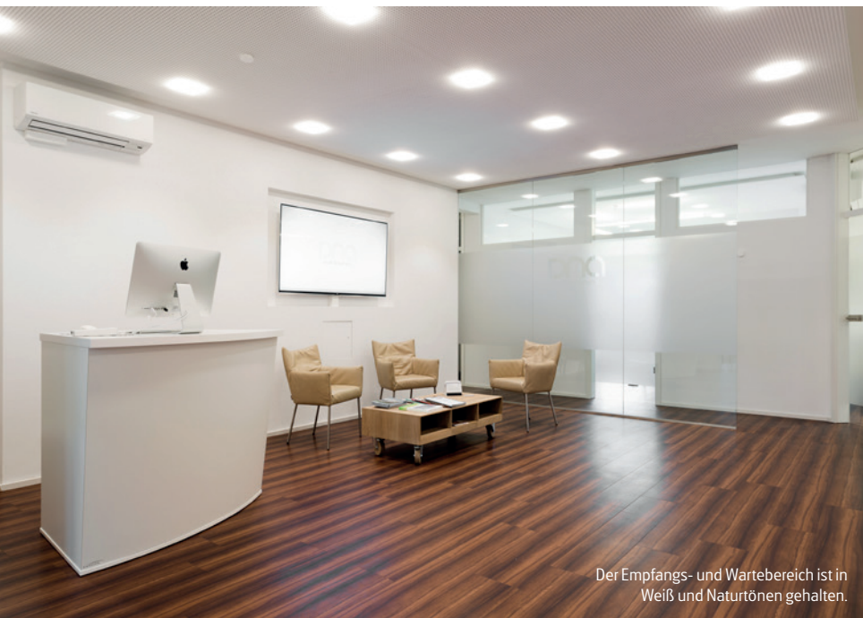
Der Empfangs- und Wartebereich ist in Weiß und Naturtönen gehalten.