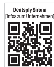
Dentsply Sirona [Infos zum Unternehmen]