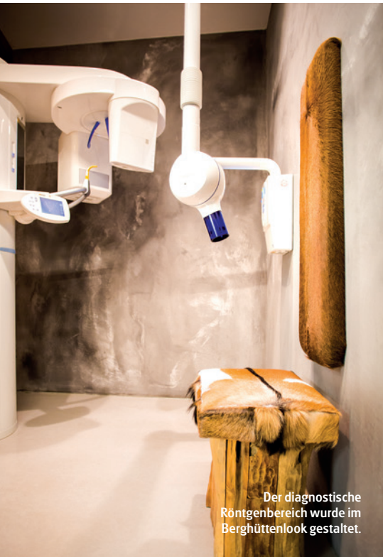
Der diagnostische Röntgenbereich wurde im Berghüttenlook gestaltet.

Wohlfühlatmosphäre spürbar werden. Das natürliche Material Holz wurde als zentrales Designelement bewusst eingesetzt, um eine besonders gemütliche Wirkung zu erzeugen. So haben wir zum Beispiel den Wartebereich und den diagnostischen Röntgenbereich im Berghüttenlook gestaltet und dadurch eine entspannende Urlaubsatmosphäre geschaffen.