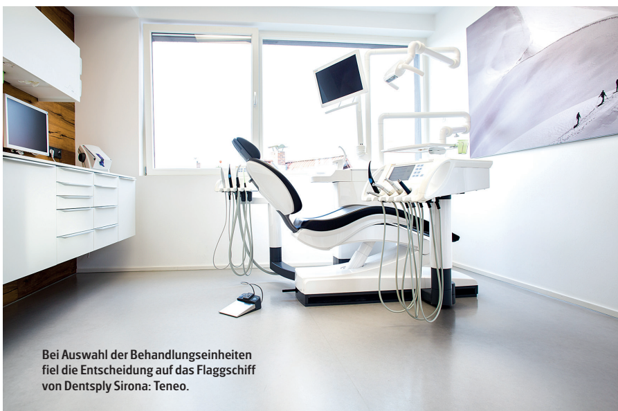
Bei Auswahl der Behandlungseinheiten fiel die Entscheidung auf das Flaggschiff von Dentsply Sirona: Teneo.

In unserer Praxis steht das Thema Komfort im Mittelpunkt. An erster Stelle ist dies natürlich der Patientenkomfort und es ist mir sehr wichtig, dass sich die Patienten in unserer Praxis wohlfühlen. Der durchschnittliche Patient beim Zahnarzt ist prinzipiell grundangespannt. Ein bequemer Stuhl mit möglichst ergonomischen und breiten Liegeflächen kann hier äußerst hilfreich sein, denn